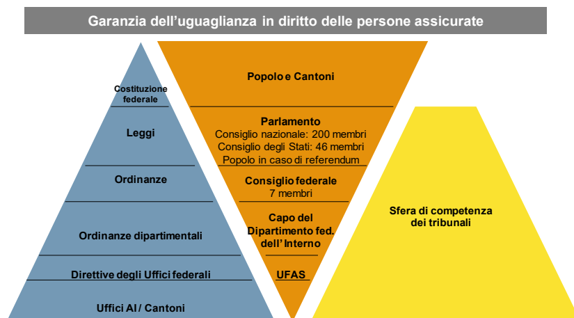
Figura 1: Gerarchia normativa