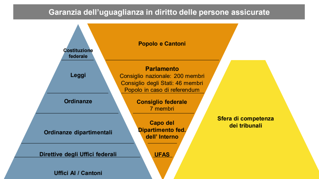
Figura 1: Gerarchia normativa