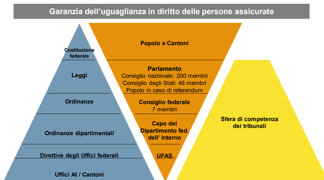
Figura 1: Gerarchia normativa