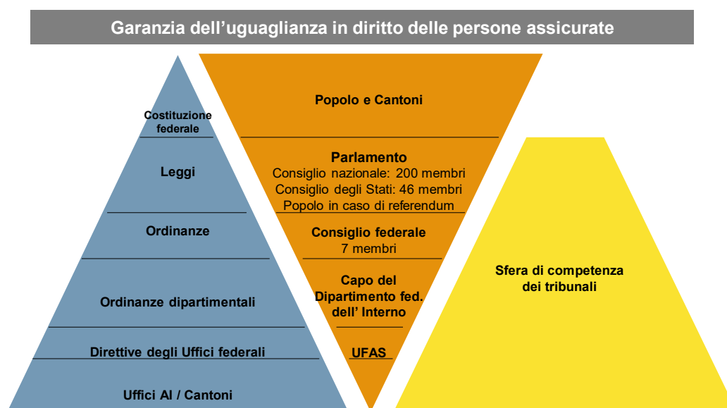
Figura 1: Gerarchia normativa