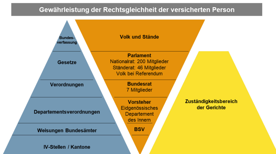
Abbildung 1: Normenhierarchie / Stufenbau des Rechts - Invalidenversicherung