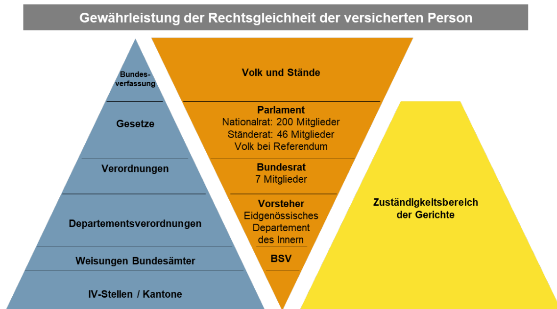
Abbildung 1: Normenhierarchie / Stufenbau des Rechts - Invalidenversicherung