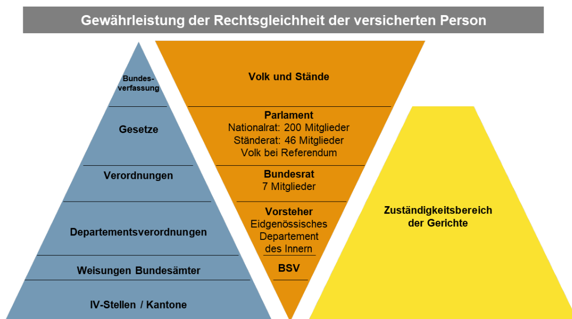
Abbildung 1: Normenhierarchie / Stufenbau des Rechts - Invalidenversicherung